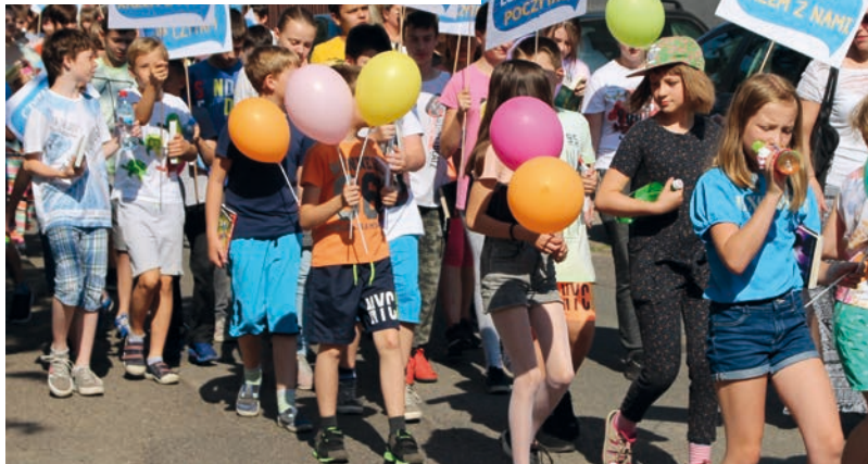
Marsz Miejskiej Biblioteki Publicznej w Piekarach Śląskich

miejscu publicznym na wspólne czytanie i dalsze atrakcje. Wydaje nam się, że ta forma sprawdzi się szczególnie w mniejszych miejscowościach, gdzie mijani ludzie będą się częściowo znali z uczniami, co zwróci ich uwagę.