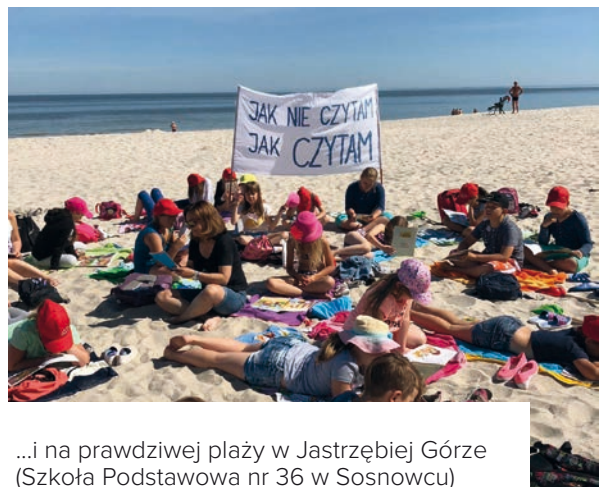
...i na prawdziwej plaży w Jastrzębiej Górze (Szkoła Podstawowa nr 36 w Sosnowcu)