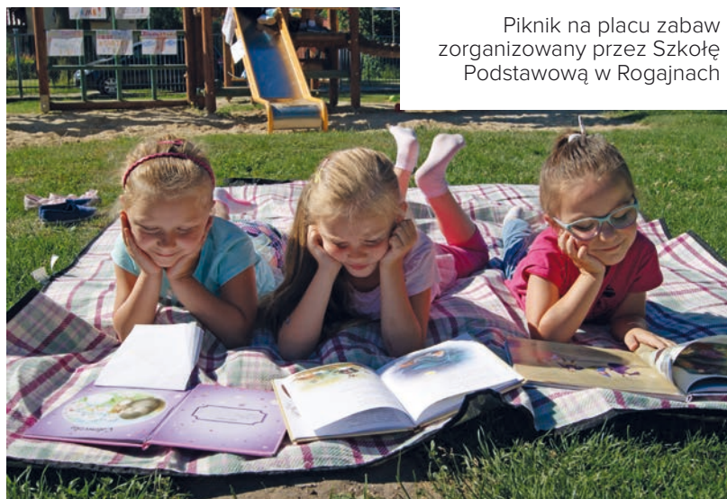
Piknik na placu zabaw zorganizowany przez Szkołę Podstawową w Rogajnach

W zeszłych latach manifestacje przekonujące, że młodzież czyta więcej, odbyły się w wielu miejscowościach. Uczestnikom towarzyszyły transparenty, hasła, megafony i przebrania. Często placówki łączyły siły, by później spotkać się na rynku lub w innym