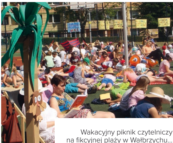
Wakacyjny piknik czytelniczy na fikcyjnej plaży w Wałbrzychu...

Nie silmy się na wielki dramat, niech będzie zabawnie. Najlepiej to zrobić wraz z nauczycielami i pracownikami szkoły, którzy mają do siebie dystans. Ten pomysł idealnie zrealizowano w SP nr 2 w Inowrocławiu – uczniowie pokładali się ze śmiechu, oglądając nauczycieli przebranych za postaci z Rzepki .